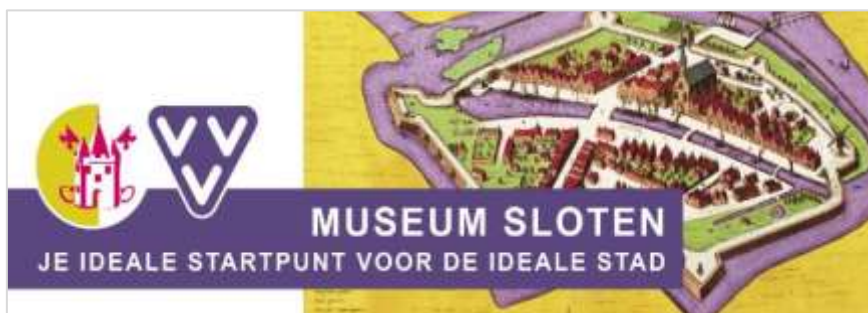
Banner van de website www.museumsloten.nl

Sloten is een stad, een unieke stad: met slechts 700 inwoners de kleinste van de elf Friese steden en de enige elfstedenstad in de gemeente De Fryske Marren. Als voormalige vestingstad is het zo gaaf bewaard dat je je echt terug waant in de tijd. Sloten is één groot monument.