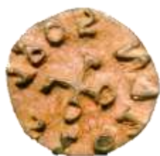
Brandmerk van de stad Sloten. Het illustreert dat Sloten als stad het recht had zelf vonnissen uit te spreken en te voltrekken.

Ondanks de geringe objectieve waarde zijn veel objecten wel zeer geschikt om de boeiende geschiedenis van de stad te illustreren. Juist daarom is het belang de objecten in die boeiende context te presenteren – wat in de huidige presentatie niet of te weinig gebeurt.