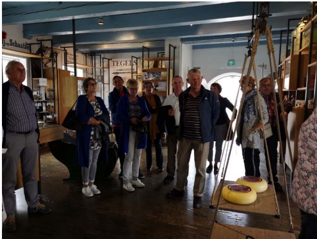
Met de vrijwilligers te gast in Museum Workums Erfskip

Jaarlijks wordt er voor de vrijwilligers een leuk uitstapje georganiseerd, meestal naar een collega-museum in de regio. Dit jaar waren we op bezoek in Workum.