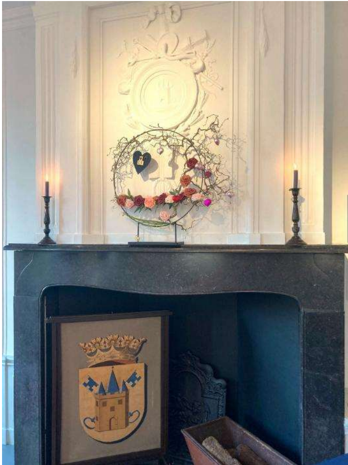
Sfeervolle aankleding van de Raadszaal voor huwelijken