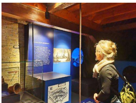
Presentatie van het thema 'water als vriend en vijand'

De kern van de presentatie wordt gevormd door drie inhoudelijke pijlers: de Friese identiteit, water als vriend en vijand en bestuur en rechtspraak. Deze thema's zijn onlosmakelijk verbonden met de geschiedenis van Sloten als vestingstad en bestuurscentrum, en geven bezoekers inzicht in de manier waarop mensen hier door de eeuwen heen hebben geleefd, samengewerkt en gestreden tegen én met het water.