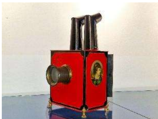
Een bijzonder fraaie toverlantaarn uit de collectie van Museum Sloten

Verder bevat de collectie een aantal niet-toverlantaarn gerelateerde deelcollecties: stereoplaatjes (11 dozen met enige honderden plaatjes), stereoapparatuur (35), fotoapparatuur (55), filmapparatuur (51), en een aantal objecten (40) in de categorie 'overig'.