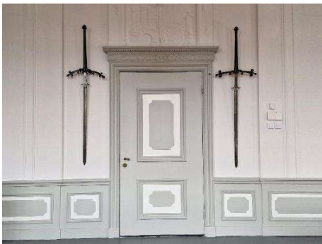
De twee tweehandszwaarden zoals ze altijd al in de Raadszaal hingen.

Met het oog op de toekomst blijft Museum Sloten investeren in de zichtbaarheid en toegankelijkheid van de collectie. In het najaar van 2026 zullen de historische tweehandszwaarden voor het publiek toegankelijk worden gemaakt. Deze objecten versterken het verhaal van rechtspraak, verdediging en machtsuitoefening en vormen een waardevolle aanvulling op de bestaande presentatie.