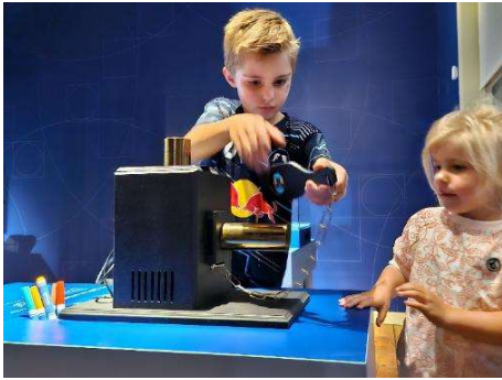
Kinderen zijn gefascineerd bezig met het projecteren van hun zelfgemaakte toverlantaarnplaatjes.

stimuleert creativiteit, historisch bewustzijn en eigenaarschap, en past binnen de ambitie van het museum om leren en doen met elkaar te verbinden.